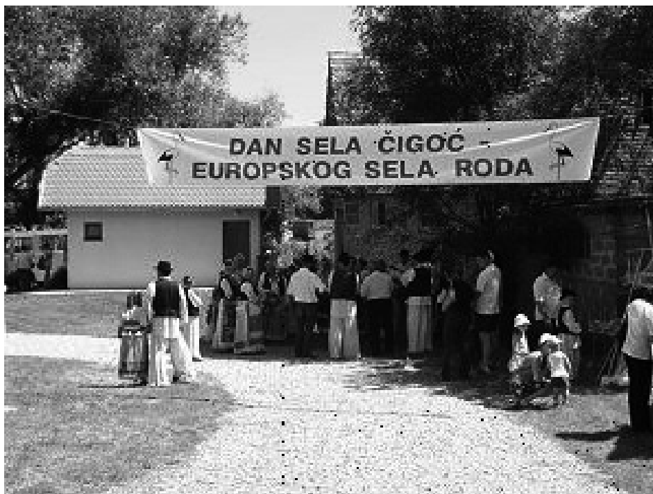
Slika 3. Primjer glokalizacije u Lonjskom polju