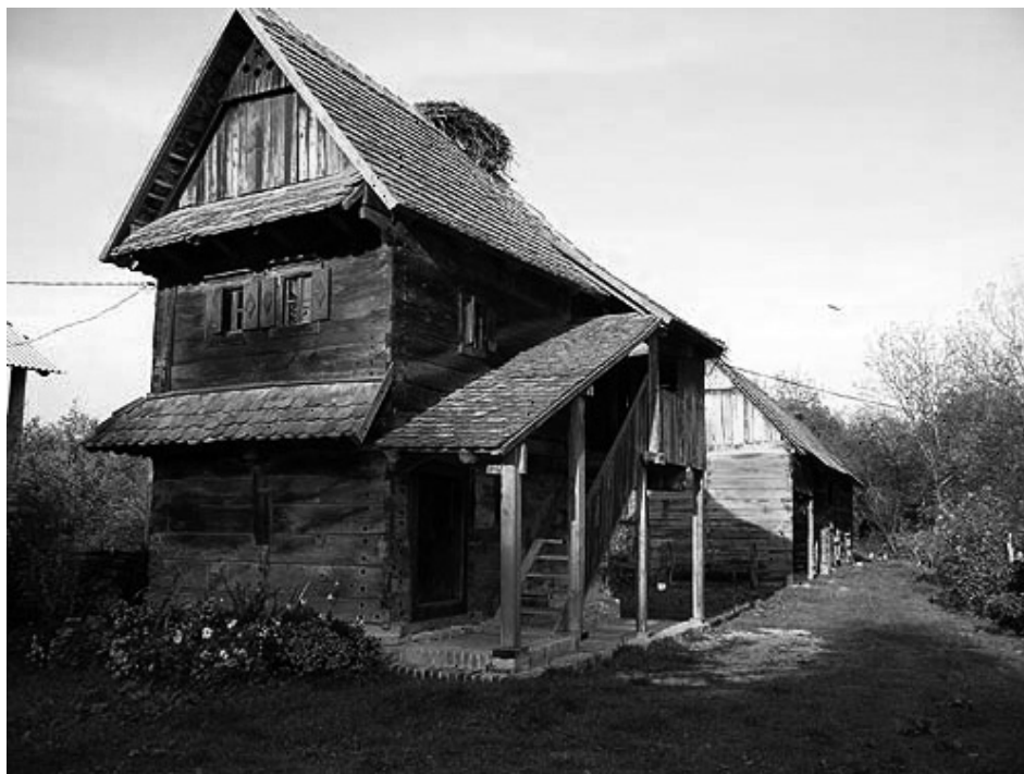
Slika 2. Obnovljena kuća u Lonjskom polju