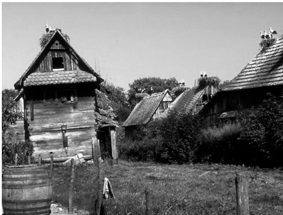
Slika 1. Tradicijska kuća u Lonjskom polju

Posebnu zanimljivost čine rode na krovovima kuća, koje ilustriraju specifičnost života na tom području – potpunu uklopljenost u prirodu, dakle skladnu simbiozu između društvenih zajednica i nekih bioloških zajednica. U zimsko vrijeme ostaju samo prazna gnijezda, rode su otišle, a i ljudi su se također povukli u svoje kuće. Posljedice toga ekološkog utjecaja koji se najviše iskazuju kroz močvaru, odražavaju se na izgled kuće: ponajprije na odabir određenog tipa materijala od kojeg se gradi – drvo, te oblikovne predloške, odabir ukrasa, ornamenata i na savez s drugim biološkim zajednicama, s rodama. Rode neće sagraditi gnijezdo baš na svakom tipu krova, na svakoj vrsti kuće, one osjećaju gdje je taj prirodni sklad održan. Što se tiče obnove baštine koju sam već spominjala, napravila sam fotografiju za primjer. Za ilustraciju sam uzela kuću direktora Parka prirode Lonjsko polje, gosp. Gugića, koji je došao iz inozemstva, vratio se i tu živi, i zaista je pokazao primjerom kako bi obnova trebala izgledati. Nažalost, to je ipak usamljen slučaj zbog različitih razloga, u prvom redu financijskih, ali i graditeljskih zbog kojih je vrlo teško i zahtjevno izvesti takav tip obnove.