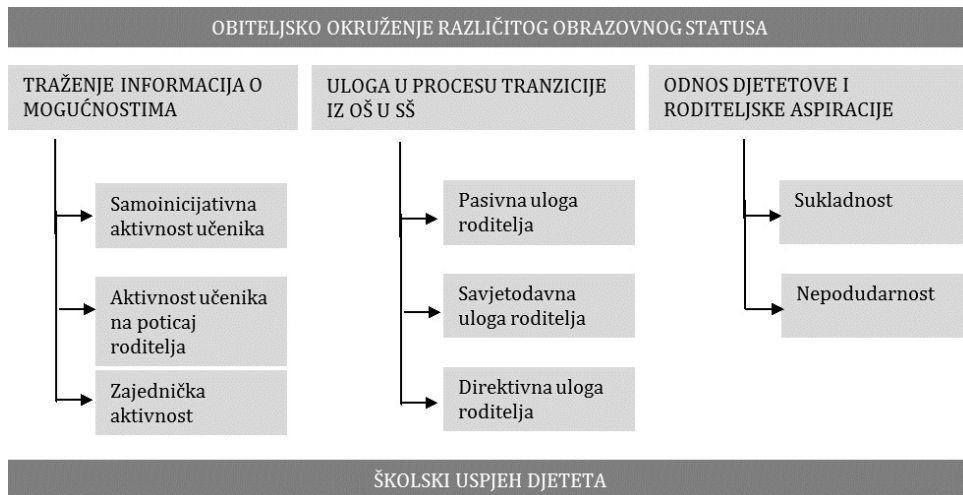
Slika 1. Analitički okvir kvalitativne istraživačke dionice

Analitički okvir razvijen temeljem tematske analize učeničkih odgovora o roditeljskim obrazovnim aspiracijama i odabiru srednje škole prikazan je na slici 1.