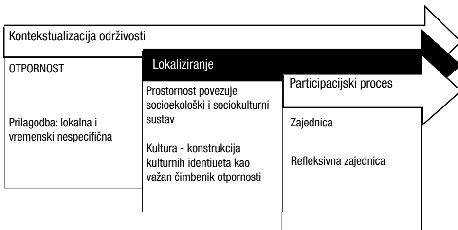
Slika 2. Prikaz konceptualizacije socijalne otpornosti

Sociološko istraživanje otpornosti i održivosti temelji se na odnosima društvenih aktera koji čine slojeve otpornosti čija uloga može biti jačanje ili slabljenje otpornosti. Upravo je zajednica mjesto u kojem djeluje širok spektar društvenih aktera čija participacija u praksama otpornosti ovisi o prostornim i kulturološkim aspektima (Allen, 1999; Keck i Sakdapolrak, 2013). Istraživanje socioprostornog i sociokulturnog konteksta produbljuje mogućnosti istraživanja, ali i razumijevanja kapaciteta otpornosti što treba uzeti u obzir prilikom izrade indikatora i strategija koje su nerijetko glavni istraživački i upravljački interes.